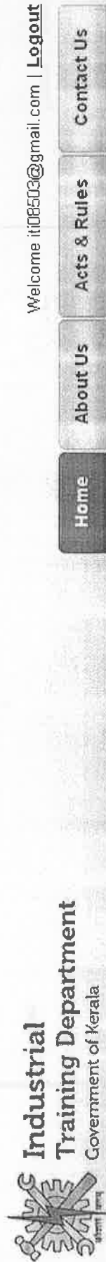
Figure - 5